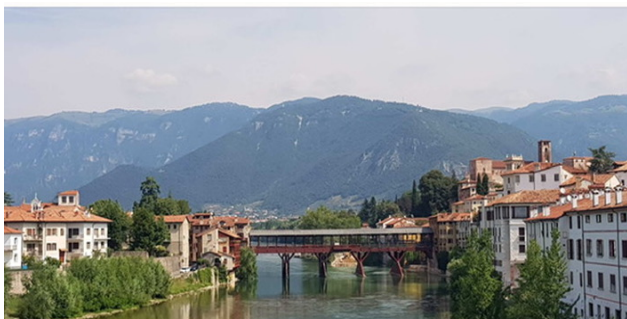
Veduta del Ponte Vecchio di Bassano

Percorso ad anello che parte da Crema. Seguiremo la ciclovia del Canale Vacchelli, suggestivi i numerosi ponti in pietra, passeremo per Tombe Morte, -Genivolta, Soncino, fino al Parco Nord del fiume Oglio che attraverseremo su fondo sterrato leggero.